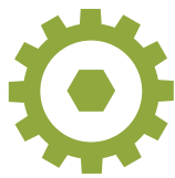
อุปกรณ์เสริม

MD533S MDVR สาย I/O สาย USB เสาอากาศ GPS เสาอากาศ 4G เสาอากาศ WiFi CD การ์ดดาวโหลด