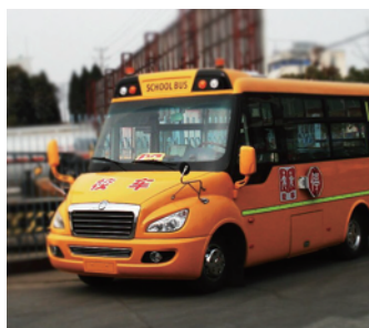
รถโรงเรียน