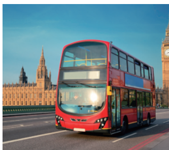
รถโดยสาร