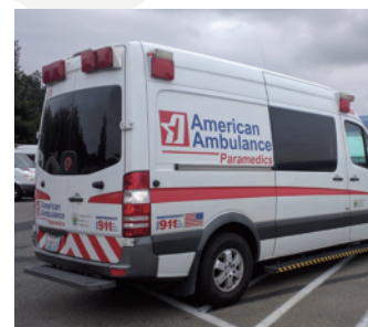
รถพยาบาล