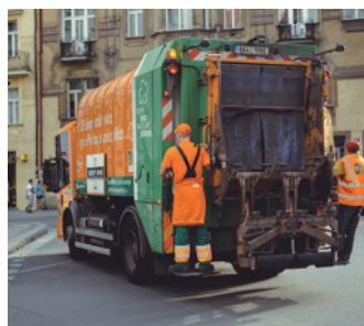
รถเก็บขยะ