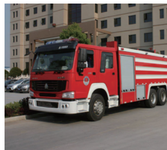
ยานพาหนะฉุกเฉิน