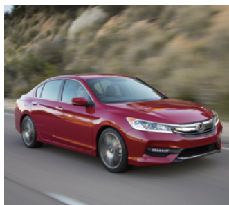
ยานพาหนะส่วนบุคคล