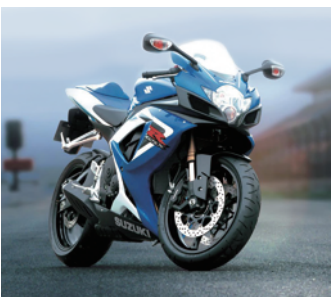
รถจักรยานยนต์