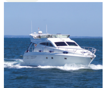
ยานพาหนะทางน้ำ